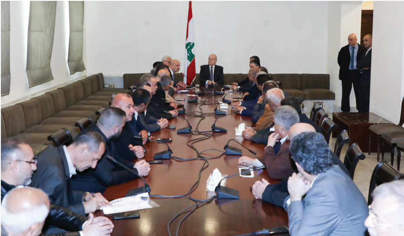
من الاجتماع في السرايا

طالب رئيس الاتحاد العمالي العام التخفيف من الضرائب والرسوم في هذه المرحلة الصعبة، داعياً وزير المال وحاكم مصرف لبنان إلى إعادة النظر بالقرارات الأخيرة، لا سيما منها الدولار الجمركي.