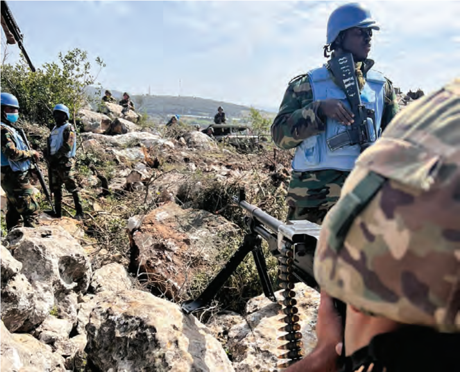
لن يقبل الجيش بحرق في منطقة خرق فتنازع عليها

اي خرق للأراضي اللبنانية ولو باستتيمترات محدودة تتجاوز العلامات المحددة في اي نقطة حدودية. فكيف ان ما حصل شكّل خرقاً بمتر واحد في نقطة فرعية متنازع عليها وقد حملت (الرقم 1)، وهي نقطة جديدة تم تعميمها «بالاحمر» منذ سنوات قليلة وتقع على بعد عشرات الامتار من منطقة الخرق المعرّف عنها بالنقطة الزرقاء التي تحمل (الرقم 13 BP)، وهي