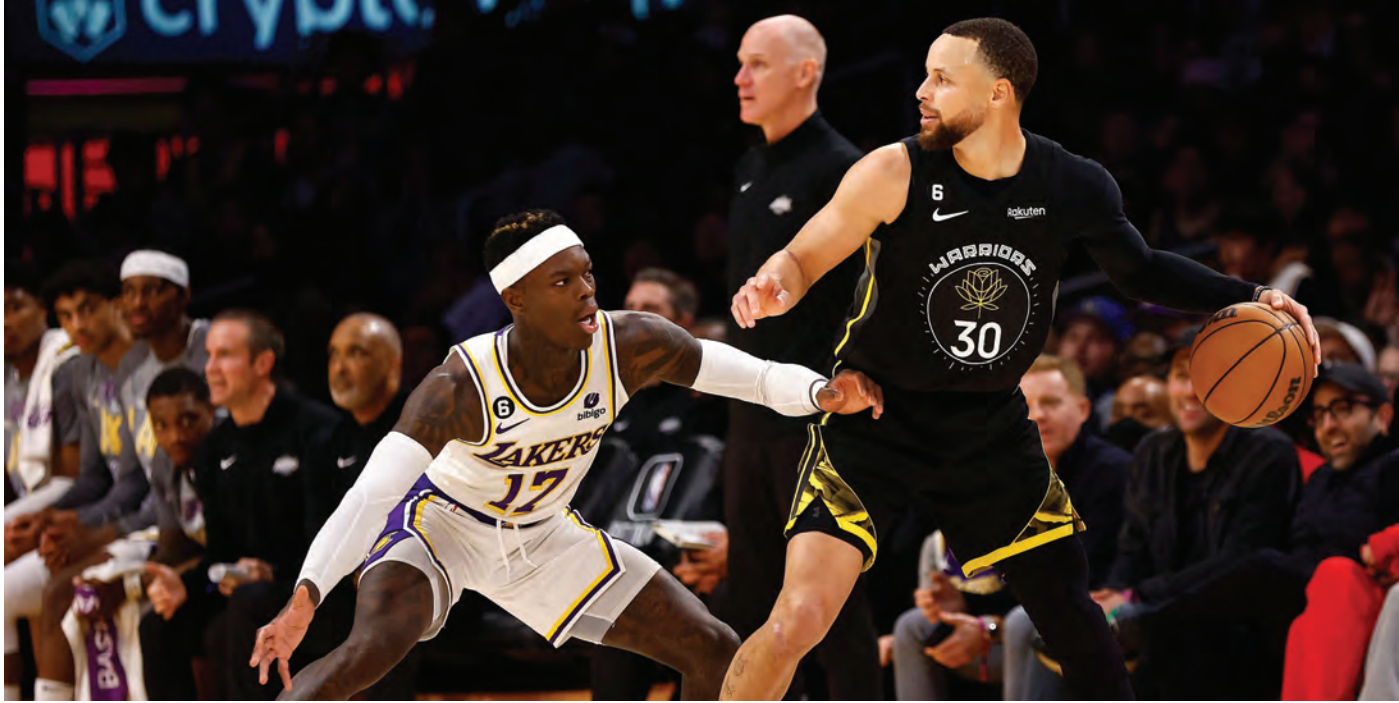
من مباراة لوس أنجلوس ليكرز وغولدن ستايت ووريزز

حقّق نيويورك نيكس انتصاره التاسع على التوالي بتغلبه على بوسطن سلتيكس 129-131، بعد التمديد، في دوري كرة السلة الأميركي للمحترفين.