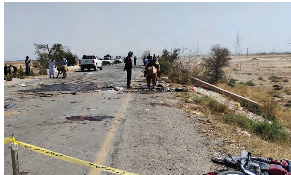
عناصر أمن في موقع الهجوم

وتستثمر الصين في المنطقة في إطار مشروع بقيمة 54 مليار دولار، يُعرف باسم الممر الاقتصادي بين الصين وباكستان، لتحسين البنية التحتية وخطوط الطاقة والنقل، بين منطقة شينجيانغ أقصى غرب الصين وميناء غوادر الباكستاني.