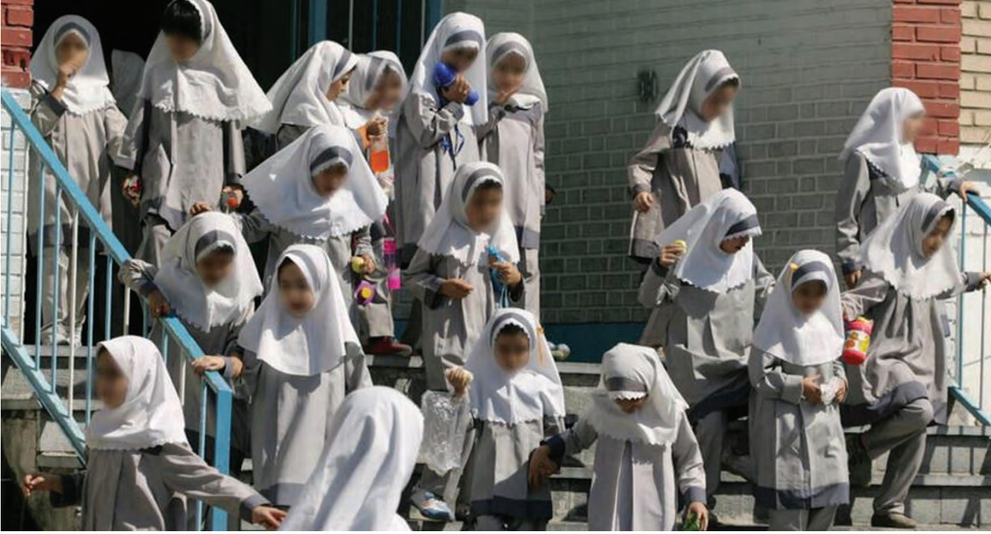
خروج تلميذات إيرانيات من مدرسة في شمال طهران

طالب المرشد الأعلى الإيراني آية الله علي خامنئي، أمس، بـ"عقوبات شديدة" بحق الأشخاص الذين سيثبت تورطهم بسلسلة حوادث تسميم بالغاز طالت تلميذات إيرانيات خلال الأشهر الثلاثة الفائتة، وتثير غضباً في البلاد.