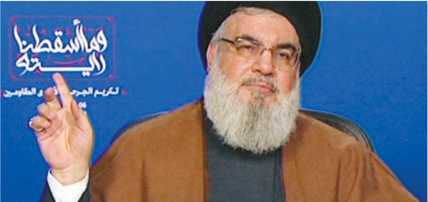
هو الوحيد الواقف على قدميه، فيما يتلشى الآخرون جميعاً على الأرض