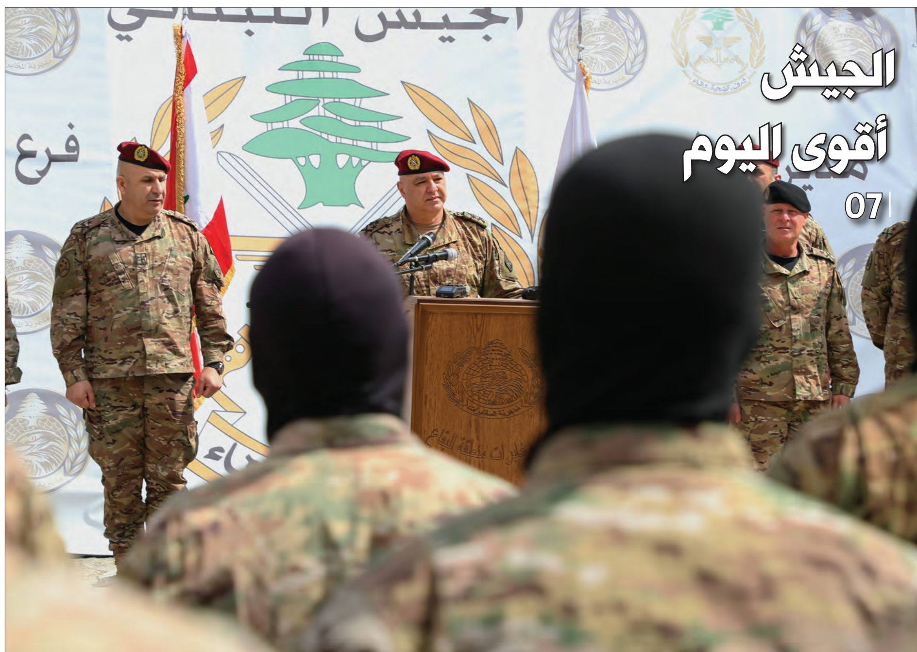
قائد الجيش يلقي كلمة في العسكريين خلال تقديمه واجب العزاء لأهالي شهداء الجيش