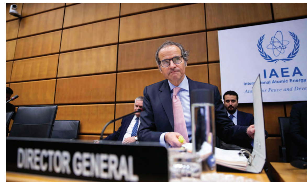
غروسي خلال إجتماع في مقر وكالة الطاقة في فيينا