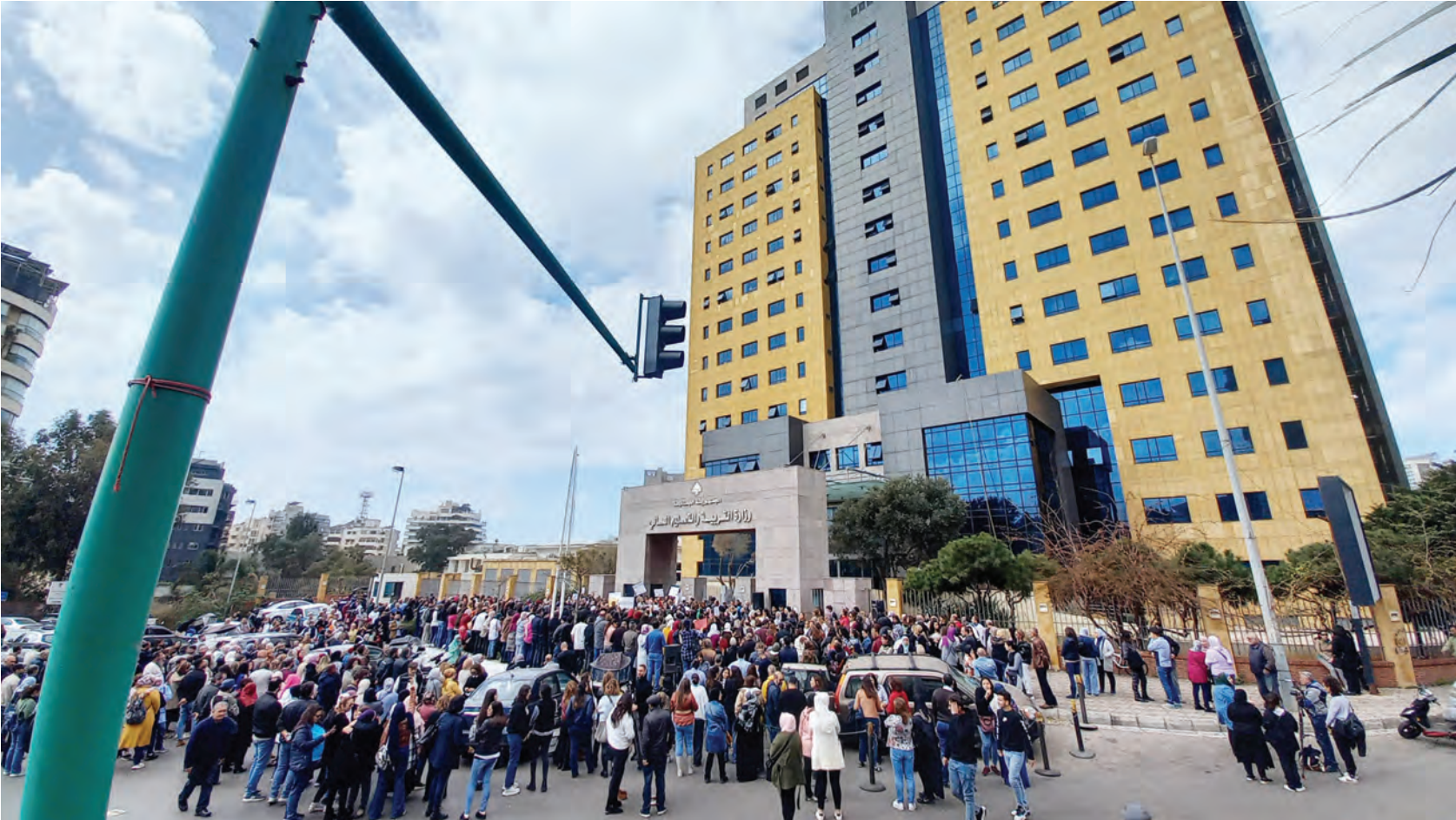
جانب من اعتمام اللجنة الفاعلة للسائنة المتعاقبون في التعليم الاساسي احتجاجا امام وزارة التربية أمس (جوزف بزالك)

أوقفت تبادلاً لإطلاق النار بين المتحاربين سجّل الأحد وحلّف خمسة قتلى، وأفادت وزارة الدفاع الروسية أن جنوداً أذربيين أطلقوا النار صباح الأحد على «سيارة (كانت تقل) عناصر من قوات الامن في ناغورني قره باغ» في بلدة جنوب العاصمة ستيباناکيرت.