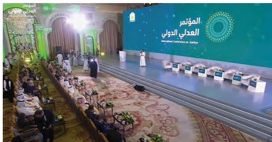
جانبا من المؤتمر

شارك وزير العدل في حكومة تصريف الأعمال هنري خوري في اليوم الثاني للمؤتمر العدلي الدولي الذي أقيم في الرياض على مدى يومين، بدعوة من وزير العدل السعودي معالي الشيخ وليد بن محمد بن صالح الصمغاني ومشاركة وزراء العدل العرب.