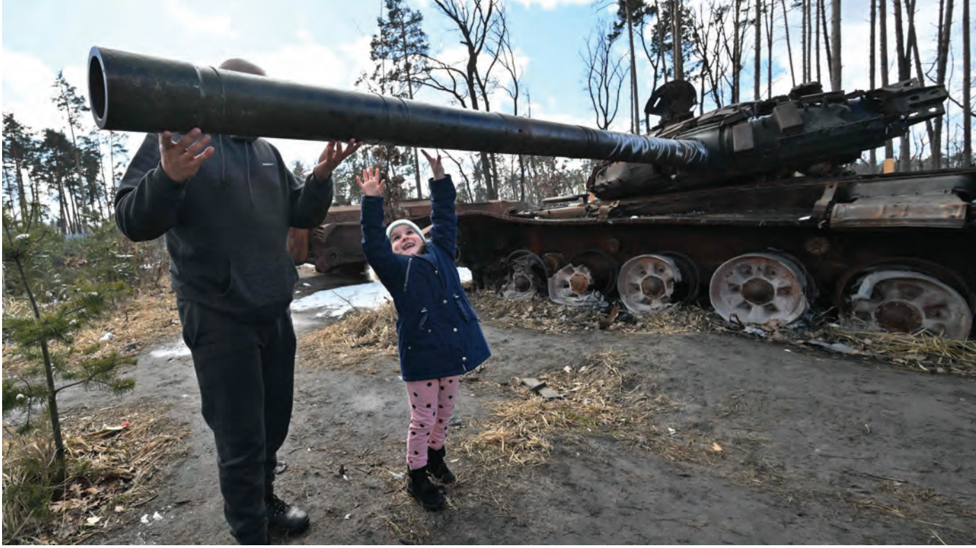
رجل وابنته يلهوان بالقرب من دبابة روسية مدققة في قرية دميتريفكا قرب كييف

أعلن وزير الدفاع الأميركي، لويد أوستن، أمس، أن مدينة باخموت في شرق أوكرانيا لها أهمية رمزية أكثر من كونها عملياتية، مشيراً إلى أن سقوطها لا يعني بالضرورة أن موسكو استعادت زمام المبادرة في الحرب.