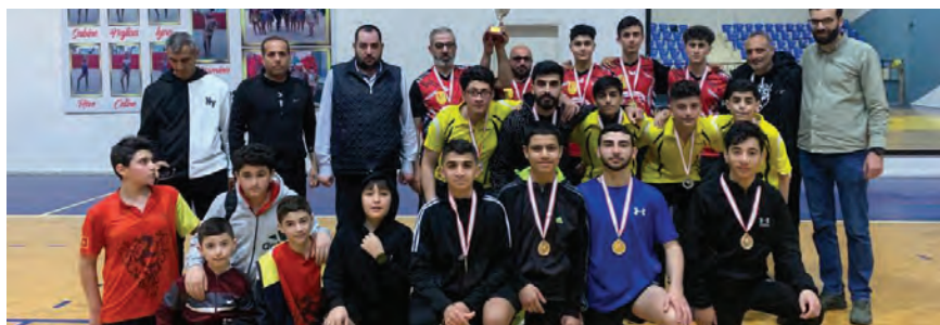
من تتويج الفرق الفائزة

الثاني في الترتيب العام. النتائج الفردية: