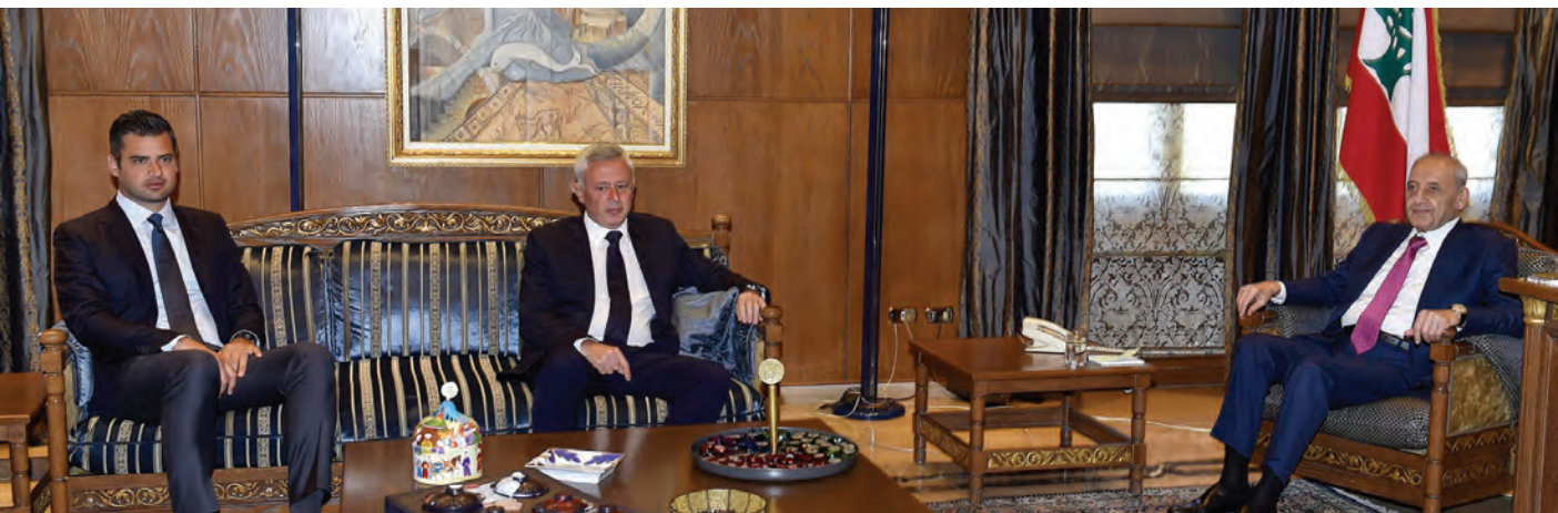
«ما أدلى به الرئيس نبيه بري والسيد حسن نصرالله لتلحية مجاهرتهما بدعم والي لم يكن مفاجئاً لنا»

التصويت له، لأنّ ترشيحه ليس فناً للفن، ومتى وجدنا أن حصوله على الـ65 صوتاً صار ممكناً سنضع اسمه في صندوق الاقتراع.» ويلفت فرنجية الى ان «ما أدلى به الرئيس نبيه بري والسيد حسن نصرالله لتلحية مجاهرتهما بدعم والي لم يكن مفاجئاً لنا، لأننا نعرف مسبقاً خيارهما كحليفين وفيين، ونحن واثقون كل الثقة في دعمهما الصادق منذ بداية الحراك الرئاسي وحرصهما على الصيغة اللبنانية.» ويتابع: «إنّ موقفيهما العنئيين يندرجان في سياق تأكيد المؤكّد، وإنما بصوت مرتفع هذه المرة، ونأمل في أن يشكل ذلك محفزاً ومحفراً لاختصار الوقت الضائع والتعجيل في الخروج من نفق الفراغ المظلم.»